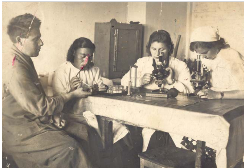
Фото 4. В лаборатории Сортировочного эвакуационного госпиталя.

Что касается культурного обслуживания наших раненых и больных силами культурных учреждений города, то от них в прошлом году мы получали большую помощь, то сейчас эта помощь значительно ухудшилась. За артистами нужно посылать по пять раз, а транспорта у нас нет лишнего. А то еще так – “накормите – пойдем, не накормите – не пойдем, далеко – не пойдем”. А вот возьмите такие госпитали, как психбольница – туда затащить лектора очень трудно. Я считаю, что сейчас надо будет об этом подумать [...]