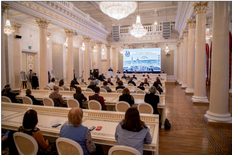
XXIV Елисаветинско-Сергиевские чтения «Российская благотворительность. Традиции и современность» (Казань, 2 ноября 2021 г.)