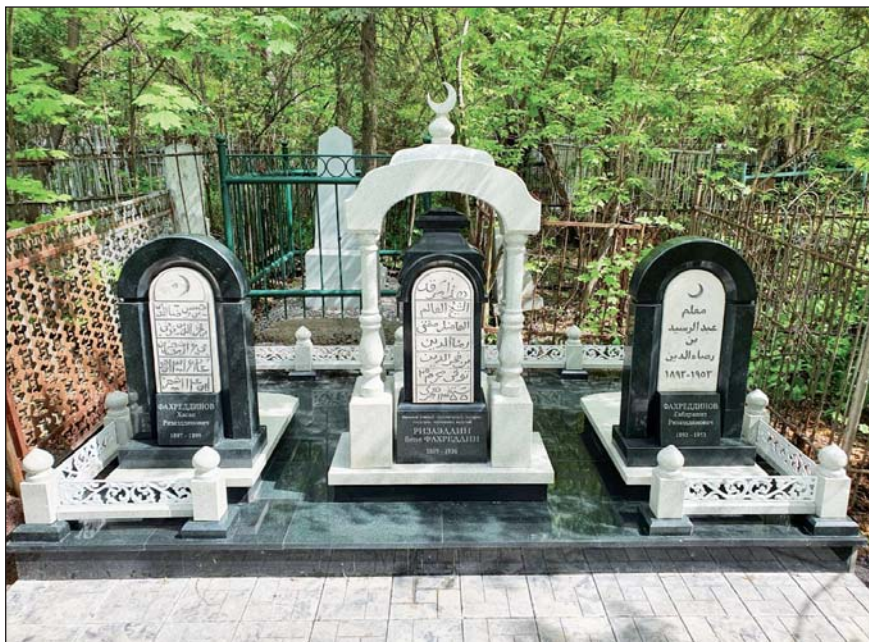
Мемориальный комплекс Р.Фахретдина в г. Уфа