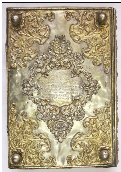
Ил. 5. Евангелие. Нижняя крышка с вкладной надписью. 1726 г.