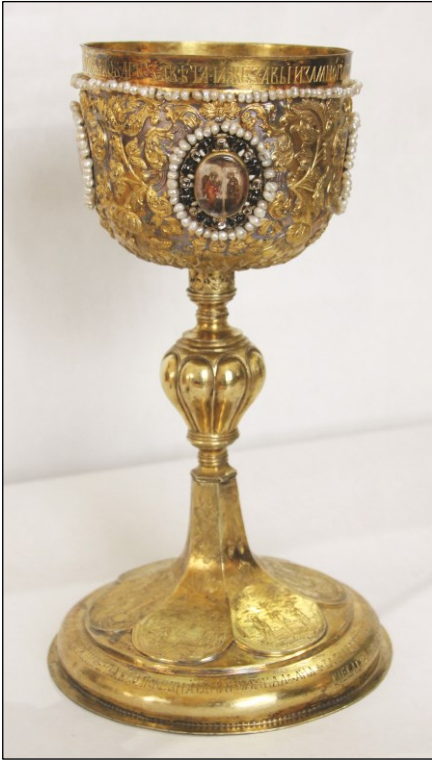
Ил. 1. Потир. 1726 г.