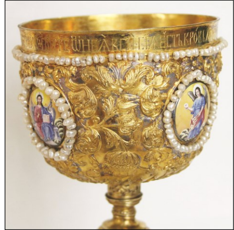
Ил. 2. Потир. Фрагмент чеканного декора на чаше. 1726 г.