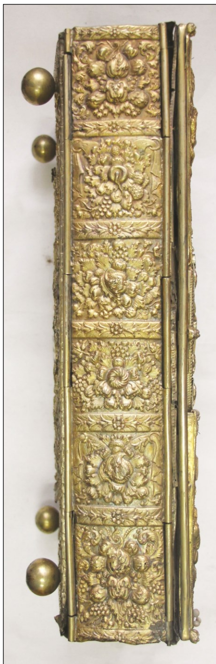
Ил. 6. Евангелие. Корешок. 1726 г.