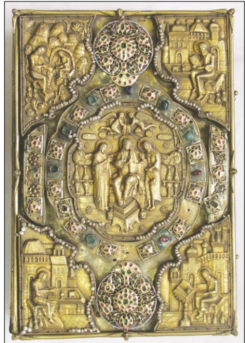
Ил. 3. Евангелие. Верхняя крышка. XVII в.